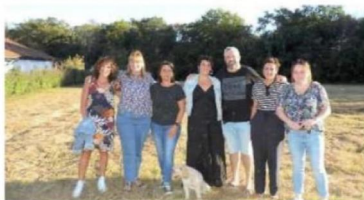
Sur le site, les deux coprésidents entourés des membres du bureau. JE.

Le contenu de cette idée novatrice dans le département, ils le résumant ainsi : « un lieu de vie collectif avec une liberté individuelle ». Concrètement, les personnes auront leur chez elles, libres de vivre à leur rythme en toute liberté et avec une envie,